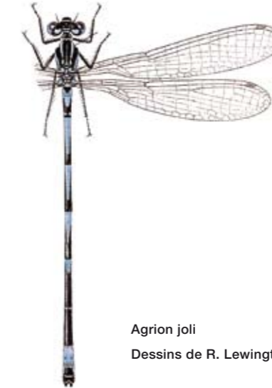
Agrion joli Dessins de R. Lewington