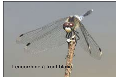
Leucorrhine à front blanc

Les observations des libellules adultes peuvent se faire entre avril et octobre lorsque la météo est clémente. Les zones humides du canton (étangs, rivières, ruisseaux) sont les habitats préférés de ces insectes. L'étude des libellules est abordable pour tout un chacun, car il y a relativement peu d'espèces et la littérature existante à ce sujet est remarquable. Le Bois des Mouilles et l'Étornel sont de bons sites d'observation.