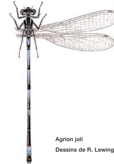
Agrion joli Dessins de R. Lewington