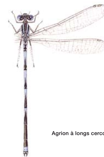
Agrion à longs cercoïdes

Les zygoptères, signifiant "ailes couplées" comprend les petites libellules appelées demoiselles, dont les ailes sont repliées au repos. Celles-ci ont un vol moins puissant que leurs grandes sœurs, leur abdomen est fin et leurs yeux sont séparés.