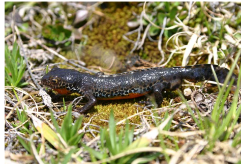
Urodèles (Triton alpestre)