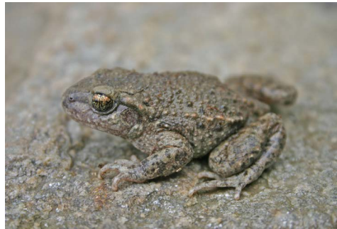
Anoures (Alyte accoucheur)

Ils dépendent toutefois tous de l'eau. En effet, se trouvant à mi-chemin entre le mode de vie terrestre et aquatique, ils ont besoin d'un certain taux d'humidité dans l'air pour survivre convenablement.